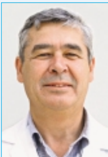
Dr. Wilhelm Schlagintweit